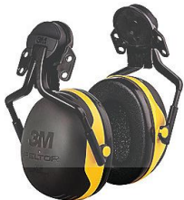
NRR 24 dB X-Series X2 adaptable a casco. Modelo X2P5E. SKU: UU007831728