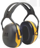
NRR 24 dB X-Series X2 con banda superior. Modelo X2A SKU: XA007707848